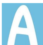
Associació Asperger Catalunya Central